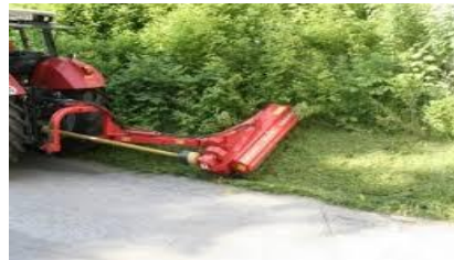
דוגמת מכסחת צד צר