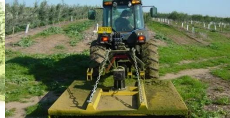
דוגמת מכסחת רגילה