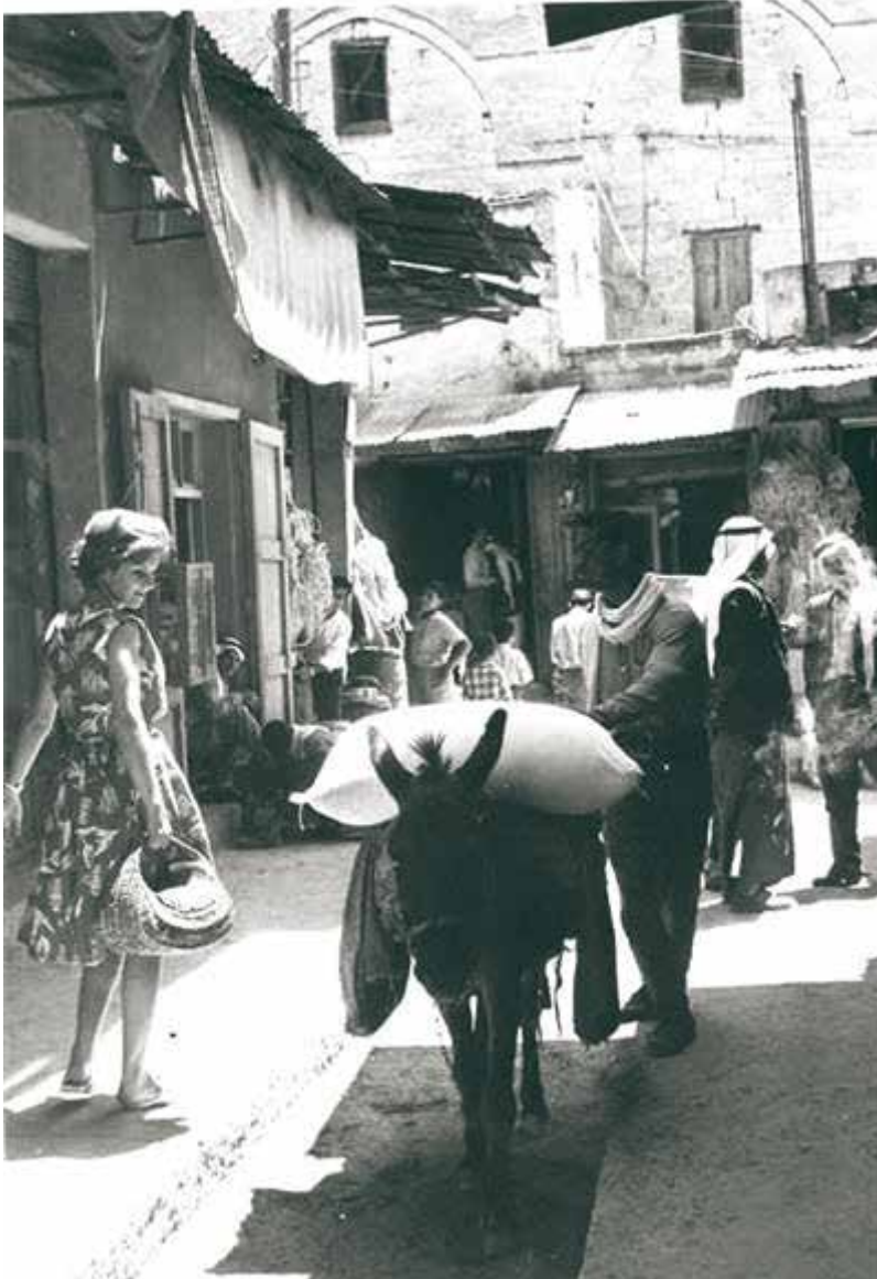
”תחומי השיפוט של רשויות מקומיות ערביות נקבעו בצורה מגבילה”. השוק בנצרת.