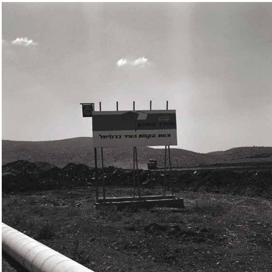
"אדמות הופקעו לצורך הקמת הערים היהודיות החדשות נצרת עלית וכרמיאל"