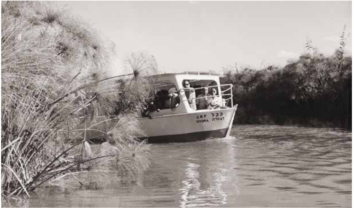
הסירה דבורה של קק"ל משייטת בשמורת החולה, 1964 (צילום: דוד הירשפלד, באדיבות ארכיון התצלומים, קק"ל).

לקהל הרחב לאחר שבמהלך יותר מ-10 שנים נפתחו שמורות טבע חדשות בכל רחבי הארץ, שהיו דוגמאות מוצלחות יותר לנושא שימור הטבע. ייתכן שאנשי שימור הטבע העדיפו להבליט את היותה של שמורת החולה הראשונה ולהפכה לסמל למאבק על שימור הטבע על רקע פרויקט ייבוש החולה, במקום להודות בעובדה, שמרבית ייחודה של החולה אבד למעשה לאחר הקמתה של שמורת החולה. ככל שהתברר עם השנים, שייבוש החולה הביא לנזקים אקולוגיים, שלא שיערו אותם מראש, טיפחו אנשי החברה להגנת הטבע ותומכיה את הנרטיב – שלפי המחקר הנוכחי אינו אלא מיתוס – שעל פיו, שמורת החולה היא דוגמה למאבק של קומץ מעטים כנגד הקונצנזוס הציוני של כיבוש השממה.