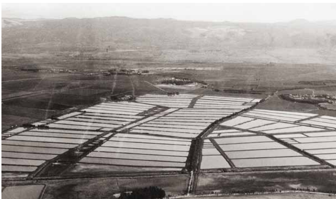
מראה החולה לאחר ייבושה ב-1.1.1978 (צילום: דב דפנאי, באדיבות ארכיון התצלומים, קק"ל).

בין הקק"ל לחברה להגנת הטבע, שניהלו ותחזקו את שמורת החולה לפני הקמתה של רשות שמורות הטבע. לסיום, מובא דיון בזירת מיסוד שימור הטבע במדינת ישראל, שמטרתו להבין כיצד השפיע תהליך הקמת שמורת החולה על גיבוש החוק והאם השמורה משקפת את רוח החוק. מסקנתו החדשנית של מחקר זה היא, שחשיפת הדינמיקה