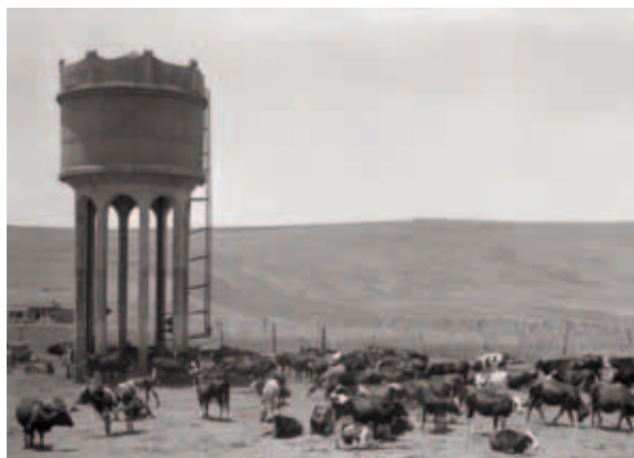
תמונה 1: מגדל המים ועדר הפרות 1928. Picture 1: Water tower and the cow herd, 1928.

בקיץ תרפ"ג (1923) פנה ארגון הפועל המזרחי להנהלה הציונית בדרישה להקים מושב עובדים, היה זה לאחר ביטול