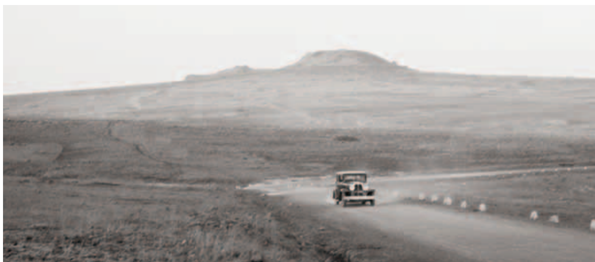
בדרך לכפר חיטים, 1934.

מהמורות, קשיים חברתיים, כלכליים, ביטחוניים ומשקיים הובילו להחלטה לסיים, בתחילת שנות ה-30, את המעשה ההתיישבותי במקום. אילוצי הזמן והמקום יצרו מציאות חדשה, שבעקבותיה הוקם היישוב מחדש במסגרת חדשנית וייחודית, נסללה דרך ונוצר מתווה דרך לעשרות יישובים שיקומו בעקבותיו. ייחודו של כפר חיטים, כפי שהוצג גם ברמה התכנונית, הוא המעבר ממושב עובדים למושב שיתופי, ותמונת מצב זו מומחשת בתכנון מחדש שביצע קאופמן לתהליך המעבר. מיקומו, האקלים הקשה, המחסור במים, בקרקע ובמקורות קיום הובילו גם בהמשך לקשיים כלכליים וחברתיים, וגם בעשורים האחרונים נדרשת התאמה לרוח הזמן ולמציאות החקלאית והכלכלית. מקומה ותרומתה של קק"ל, כפי הוצגו במאמר, באו לידי ביטוי בהיבטים הקרקעיים, התכנוניים והנופיים. כל אלה גם יחד יוצרים את סיפורו הייחודי של כפר חיטים, סיפור של ראשוניות תחת השמיים הגליליים ועל האדמה הבזלתית השחורה.