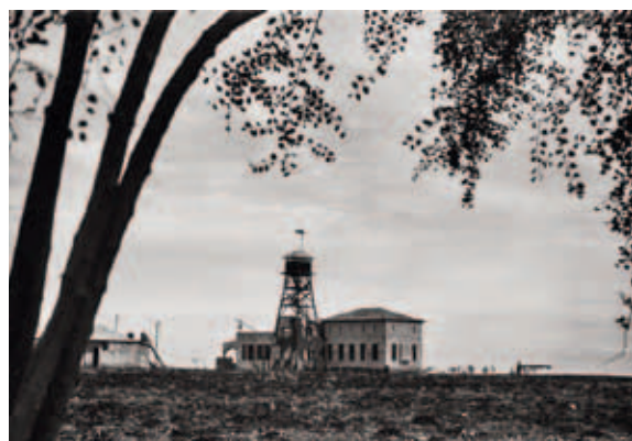
תמונה 4: בית הביטחון והמגדל, 1939. Picture 4: The defense block and watchtower in 1939.

צורת ההתיישבות של המושב השיתופי נוצרה, כאמור, במהלך שנות ה-30 של המאה הקודמת על ידי הקבוצה שביקשה לנווט את דרכה בין הקיבוץ למושב העובדים,