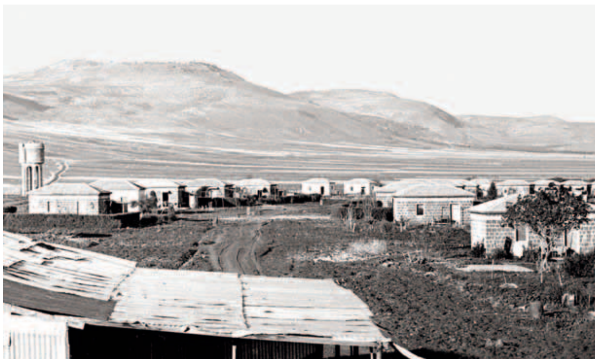
תמונה 6: בתי הבזלת בכפר חיטים על רקע קרני חיטין, 1945, Picture 6: The basalt stone houses with the Horns of Hattin in the background.