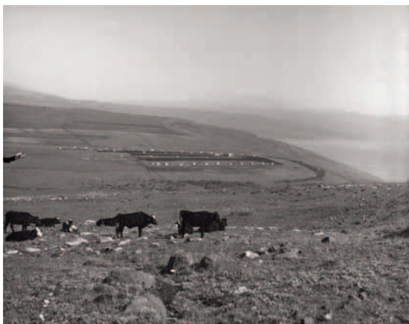
תמונה 3: כפר חיטים 1928, מדרום לצפון.