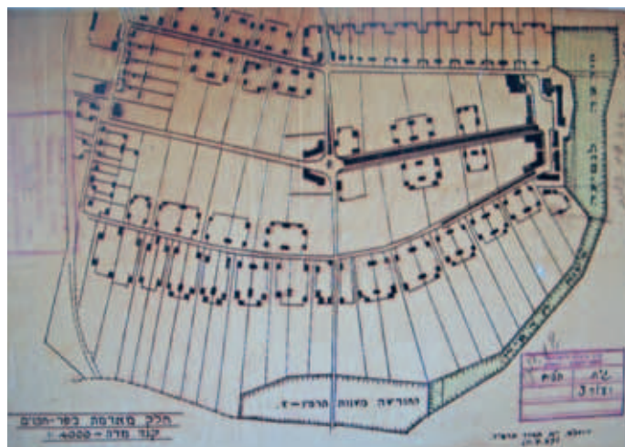
תמונה 7: תכנון מול ביצוע. תכנון הייעור של ק"ל תרפ"ו-תרפ"ח (1926-1928). JNF forest plan at Hittim 1926-1927 (Aerial photograph 2005).