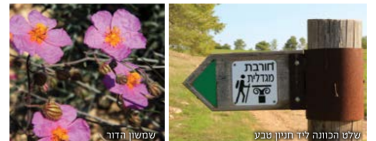
שלט הכוונה ליד חניון טבע