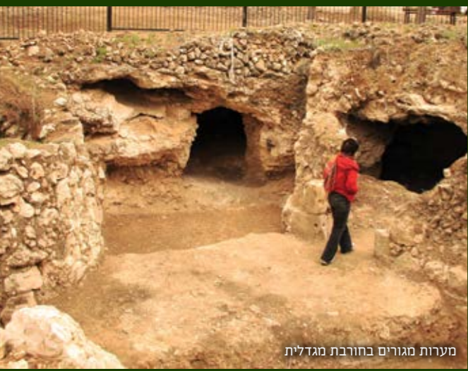
מערות מגורים בחורבת מגדלית