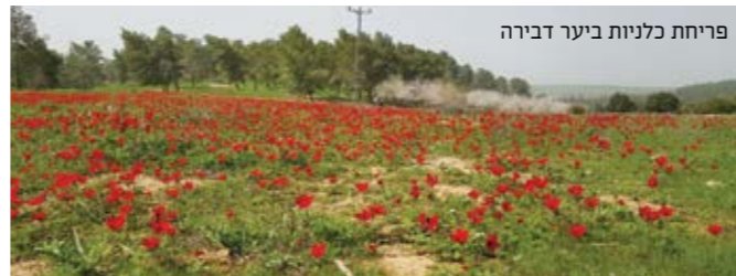
פריחת כלניות ביער דבירה

עתה כל שנותר לעשותו הוא להמשיך במורד הדרך לחניון "טבע".