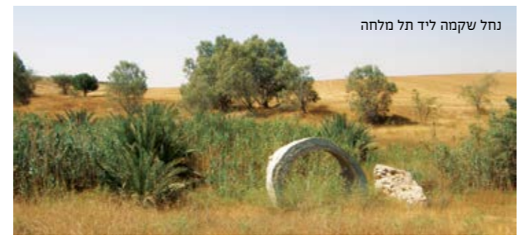
נחל שקמה ליד תל מלחה

נחל שקמה מתחיל את דרכו בגבעות שממזרח לחניון "טבע". יובלו העיקרי, נחל אדוריים, מנקז את מורדות הרי חברון. נחל שקמה הוא נחל אכזב, למעט קטעים קצרים ליד תל נגילה ותל חסי (ממערב לכביש 40), שם נחשפים מי