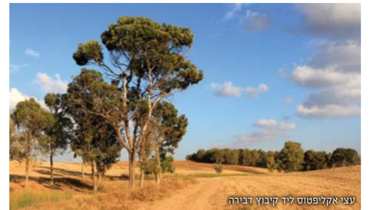
עצי אקליפטוס ליד קיבוץ דבירה

המרחב הגדול של היערות ושטחי החקלאות משמשים בסיס לאוכלוסיות גדולות של בעלי חיים ובהם צבי ארצישראלי, תן, שועל, דרבן, ארנבת ומיני מכרסמים אחרים.