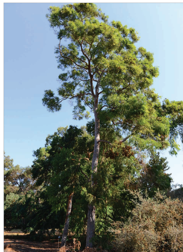
אנגופורה קוסטטה