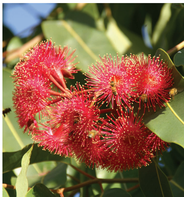
קורימביה פטיכוקרפה, פרחים ופירות