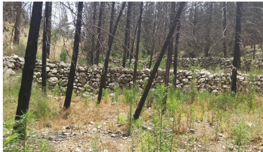
איור 2 ואדי עין כרם ביער ירושלים לפני השרפה רוב היער היה מחטני נטוע – בעיקר ברושים – ומיעוטו עצים רחבי עלים. בתמונה רואים עצי ברוש שניטעו על הטרסות ביער ונשרפו, קיץ 2014.