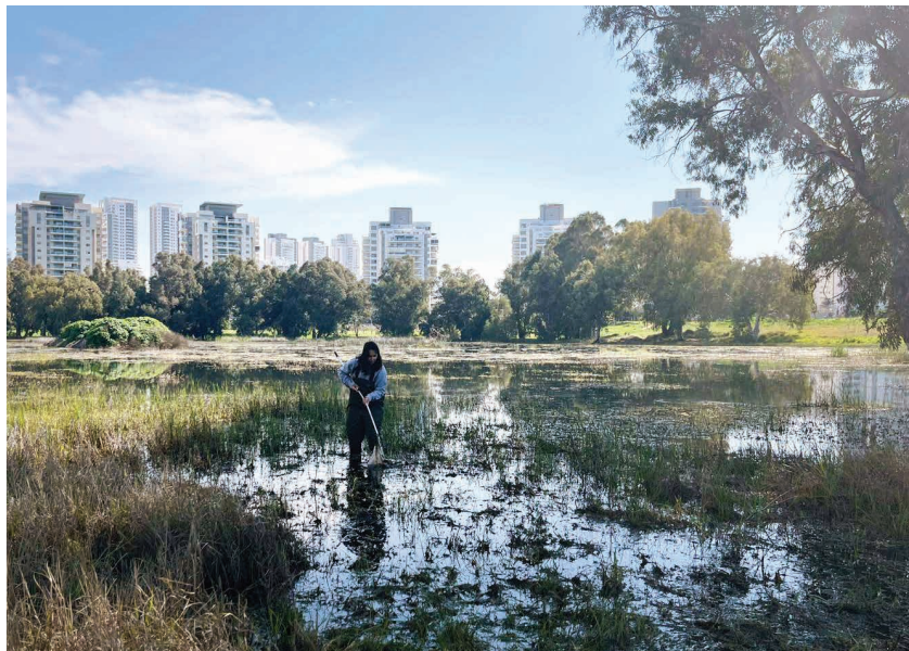
השתלמות בריכות חורף בשרון 2024

מחזור החיים של השפירית. עמוד מתוך חוברת ההדרכה "בריכת החורף" שהפיקה החטיבה לחינוך ולקהילה של קק"ל איור: טוביה קורץ