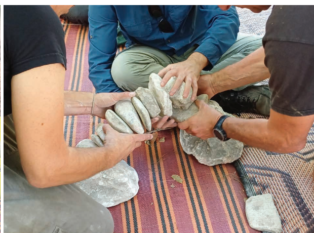
השתלמות מדריכים בשוני, סדנת איזון אבנים