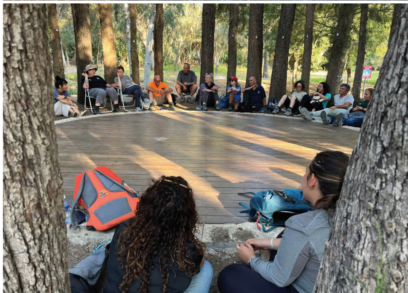
השתלמות לילה באילנות