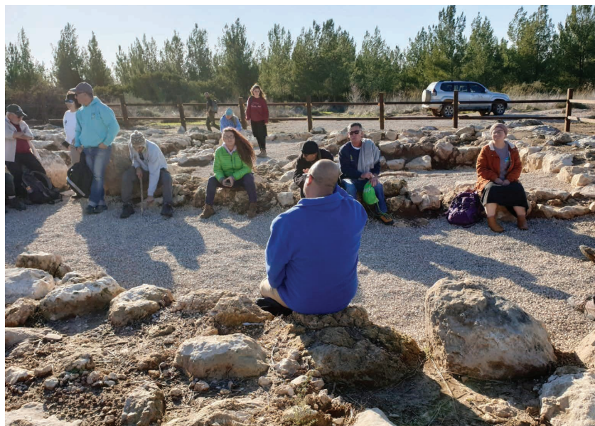
מצודת גלאון, יער בית גוברין, יוני 2020