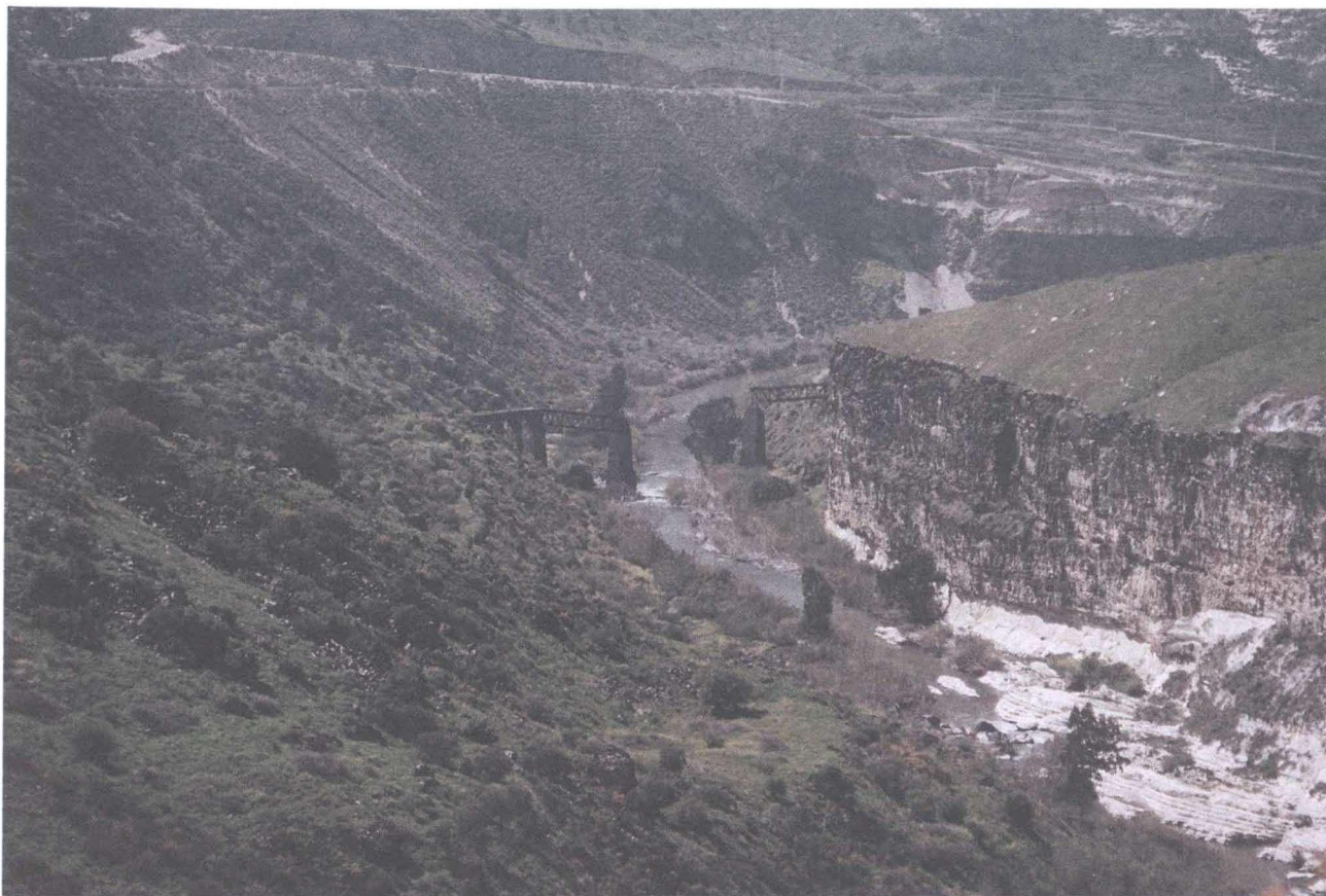
נהר הירמוך במפגש הגבולות בין ישראל, ירדן וסוריה-לאורך דרך המערכת שסלל משרד הביטחון.