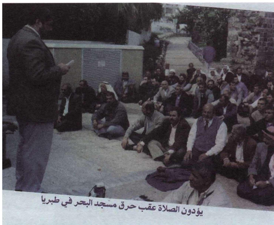
תפילה פוליטית ב"אתר קדוש" בטבריה