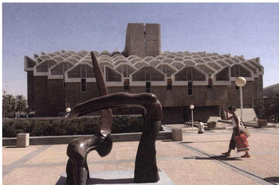
אוניברסיטת באר שבע. היעד – משיכת מתיישבים צעירים ואיכותיים