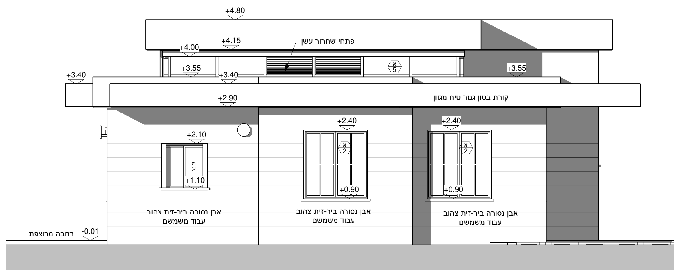
חזית ציידית 2

הערות: * על הקבלן לודא שהתכניות מבוצעות ע"פ היתר בניה כחוק! * תחילת ביצוע בשטח מותנית בקבלת היתר בניה כחוק! * הקבלן אחראי לדיווח על כל סטייה מהיתר הבניה. * אין לקחת מידות מהתכנית. הקבלן אחראי למידות ושטחן באחר. * כל אי התאמה במידות תחונן למידות ולתכנית העבודה יעשה רק בהתאם להוראות המתכננים שיעובד בכבל. * המבצע אחראי לכך שכל האלמנטים והאבזורים הם בעלי חזקתן או עמדים בדרישות חוק התכנון והבניה. * מנהלים אחראי לעמידת הבנו בתרשות התקן: * ת"י 1045 בידוד טרמי של בניי מגורים, ת"י 1004 דרישות לבידוד אקוסטי בבניי מגורים, מפרט 201 יריעת ביטומן לאיטום המותקנת בריתוך או בהדבקה. מפרט 398 יריעת לאיטום גנות, מפרט 390 חומרים לאיטום מבנים תת קרקעיים, ציפויים על קירות חוץ והאיטום מתחתם. * כל מפלסי ק.ת. של פתח מתיחסים אל פנים החדר שבו נמצא הפתח כאל 0.00. * מפלס החלון המסומן הוא פתח הבניה ללא סף החלון. * משי צידי כל דלת יש לעקת עמודון בטון הקשור לרצפה ולחגורה מעל הפתח. * כל קיר חופשי יסתיים בעמודון בטון הקשור לרצפה ולתקרה. * מפלס חדרים רטובים יבוצע בגובה הנמוך ל 1 ס"מ מפני ריצוף הדיירה.